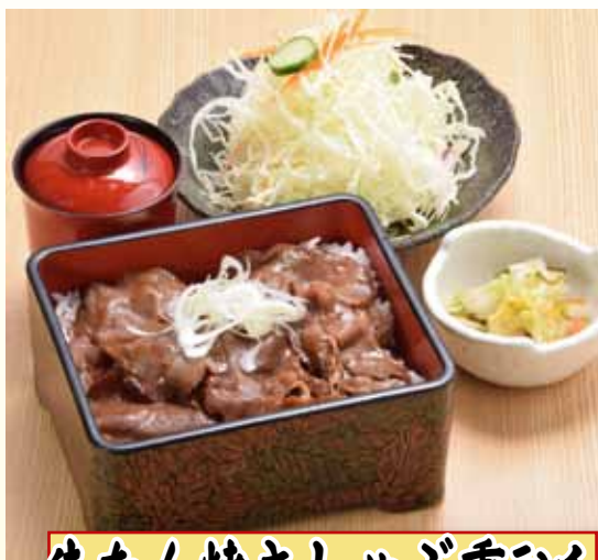
牛たん焼きしやぶ重ランチ 980円+税