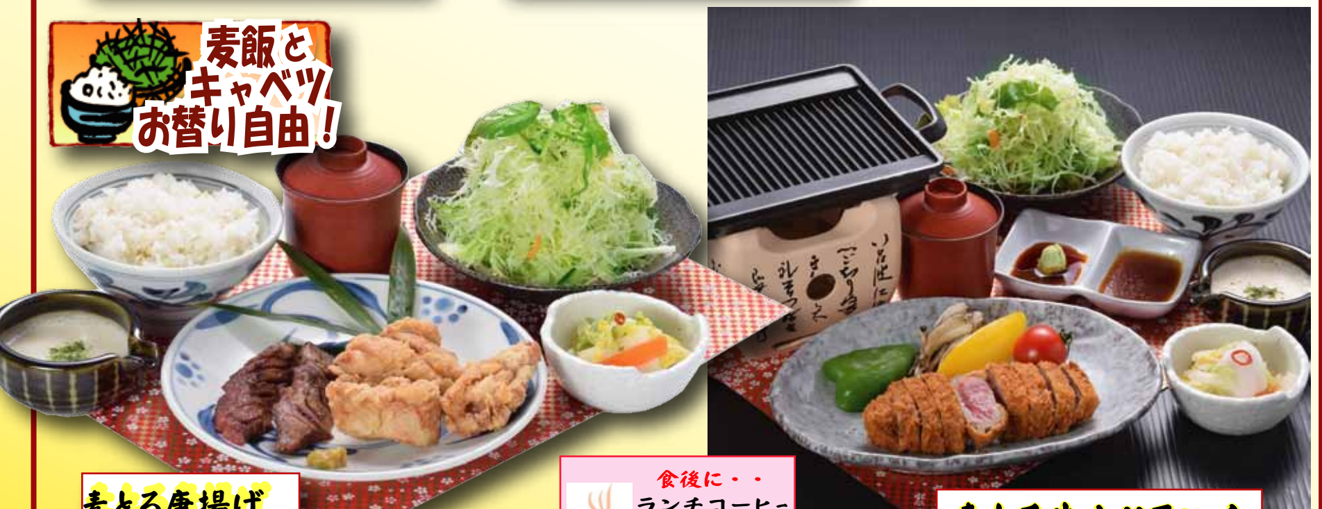
麦とろ唐揚げ牛たんランチ 980円+税

食後に・・・ ランチコーヒー (ホット・アイス) 150円+税 ランチアイスクリーム (バニラ・季節アイス) 180円+税