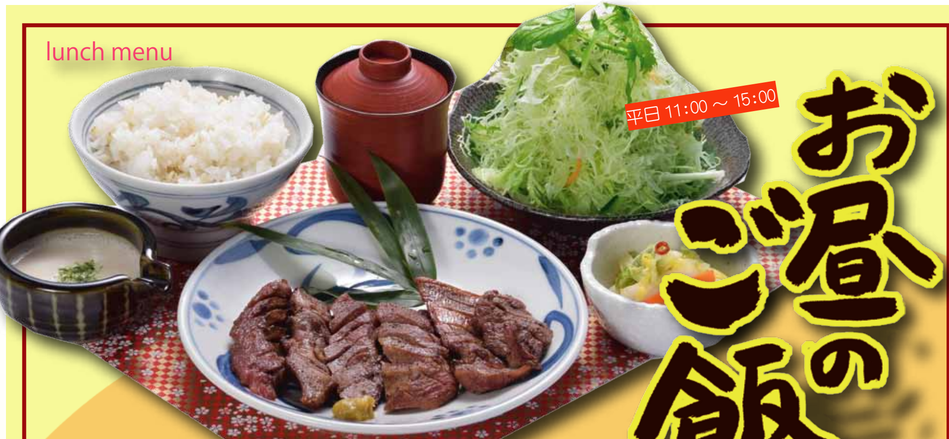
お昼のサービス牛たんランチ 1,280円+税