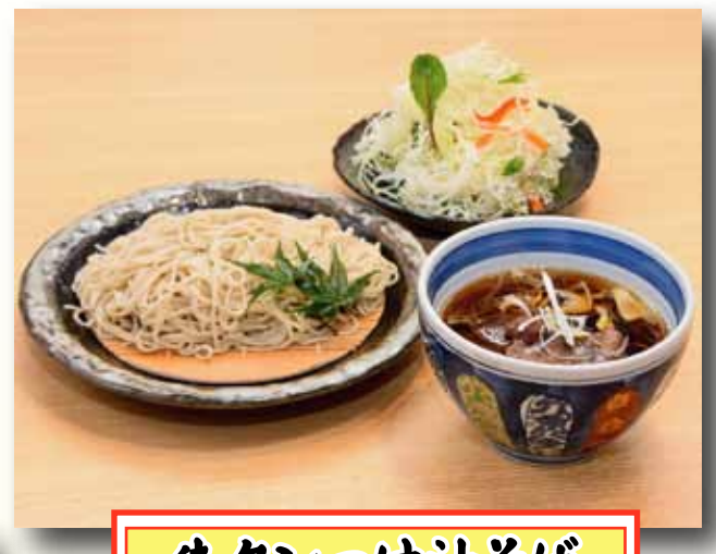
牛タンつけ汁そば 980円+税